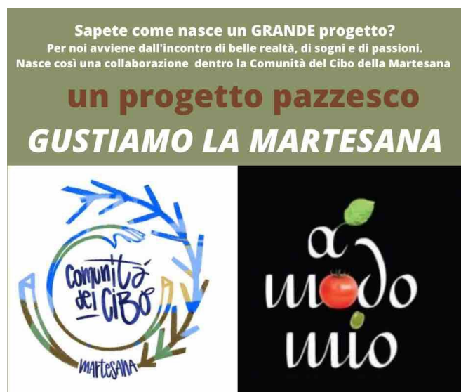
Una delle iniziative del percorso di costruzione della Comunità del Cibo Martesana

Il percorso "Verso una Comunità del Cibo per nutrire la Martesana" è stato avviato nel 2021 da Economia Solidale della Martesana (ESM); tramite alcuni incontri, "che hanno coinvolto le organizzazioni agricole, sociali e solidali del territorio, [in cui è stata abbozzata] l'idea di attivare una rete ambientalmente sostenibile, di tutte le realtà legate alla produzione e al consumo di cibo nel (nostro) territorio" (dal sito del progetto). È iniziata una 'mappatura' delle realtà territoriali, a partire dalle Aziende Agricole e dai GAS e dalla predisposizione di schede per associazioni, aziende di trasformazione, esercizi commerciali di prossimità, esercizi di ristorazione 10 ; è stato redatto un Documento d'intenti: "Una 'comunità del cibo' per nutrire la Martesana preservandone il territorio dalla cementificazione". Il percorso procede con lentezza anche per il difficile coinvolgimento degli stessi componenti di ES Martesana e richiederebbe di essere supportato e tutorato da operatori dedicati non volontari e di confrontarsi con altre esperienze più mature. In particolare, è sentita l'esigenza di un rapporto diretto e di un accreditamento sul tema da parte di alcune Amministrazioni.