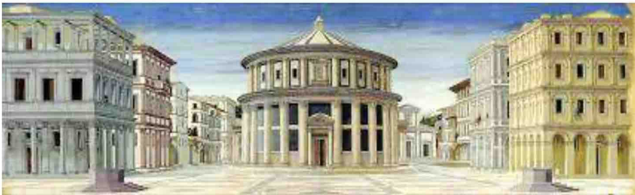
La città ideale di Leon Battista Alberti