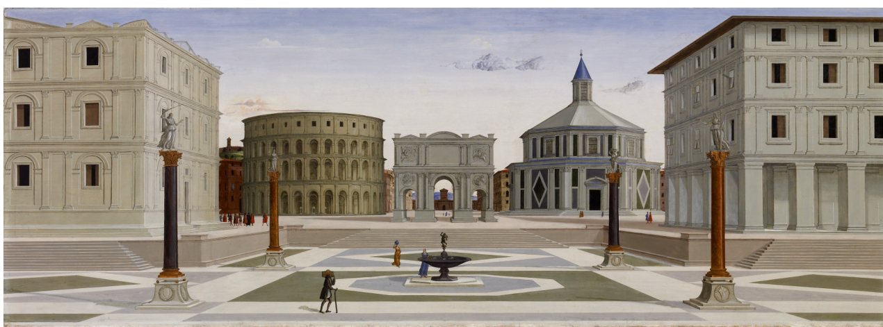
La "città ideale" alla fine del XV secolo: dipinto di anonimo fiorentino conservato al Walters Art Museum di Baltimora.

Questo modello di città, cui fa riferimento la maggior parte degli urbanisti e che ha guidato lo sviluppo delle città attuali anche dei paesi occidentali, in cui già abita il 70% della popolazione, come in Italia, richiede un flusso crescente e stabile dall'esterno di risorse e di energia.